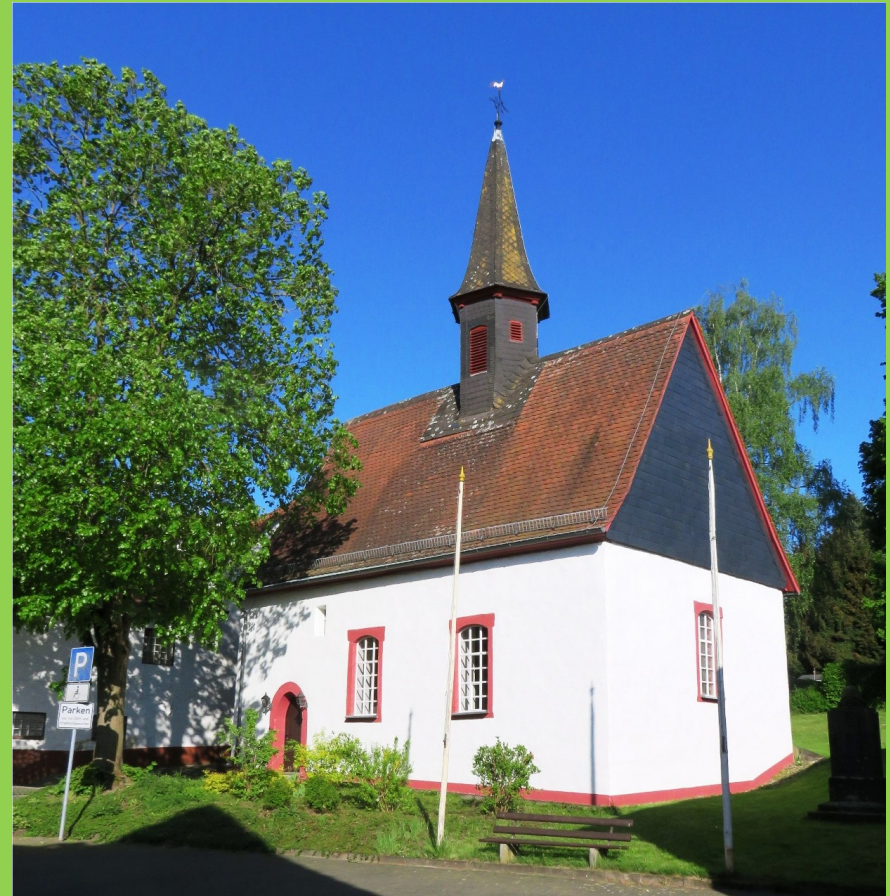
Die Kirche Beltershain im Sommer